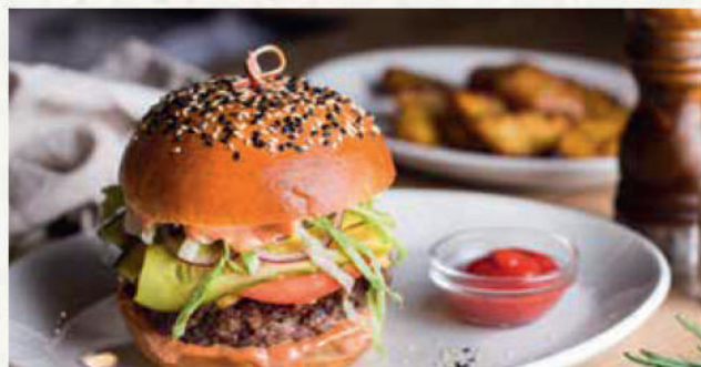
Мраморный чизбургер Marbled Beef Chesseburger