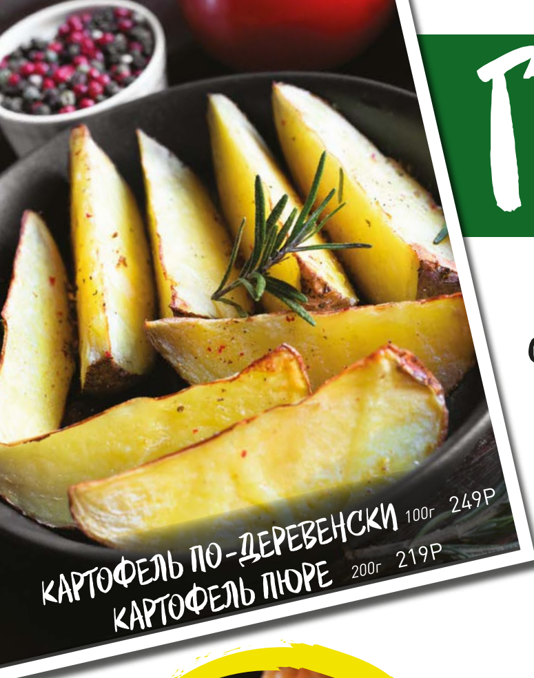
КАРТОФЕЛЬ ПО-ДЕРЕВЕНСКИ 100г 249Р КАРТОФЕЛЬ ПЮРЕ 200г 219Р