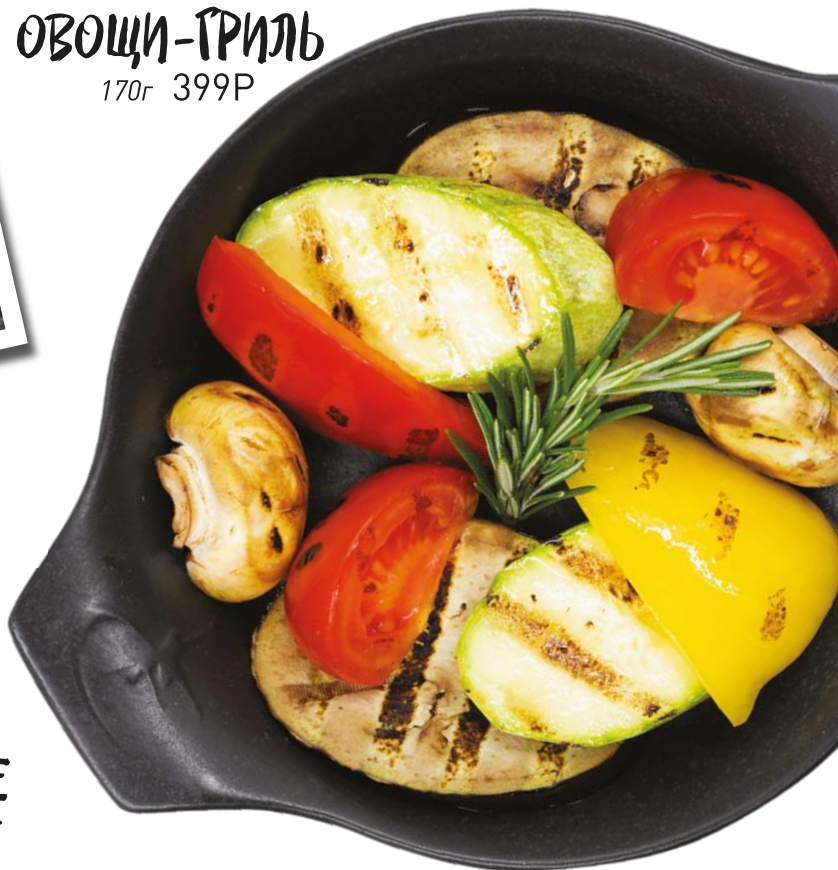
ОВОЩИ-ГРИЛЬ 170г 399Р