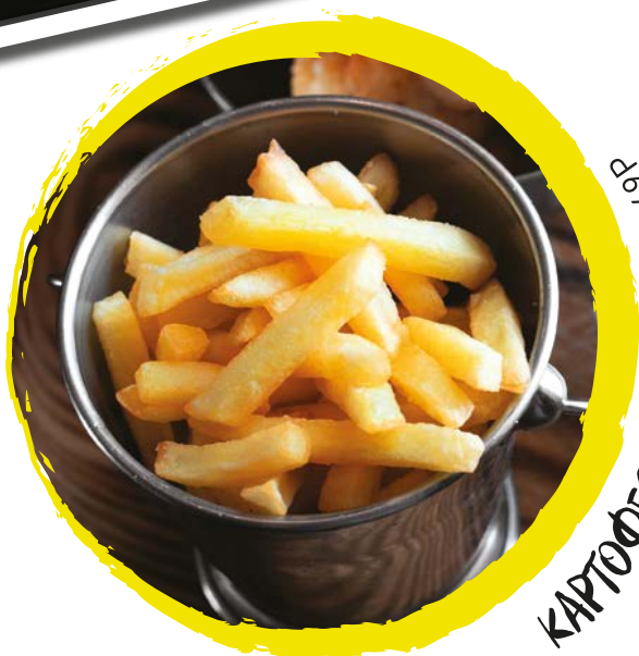
КАРТОФЕЛЬ-ФРИ 100г 249Р